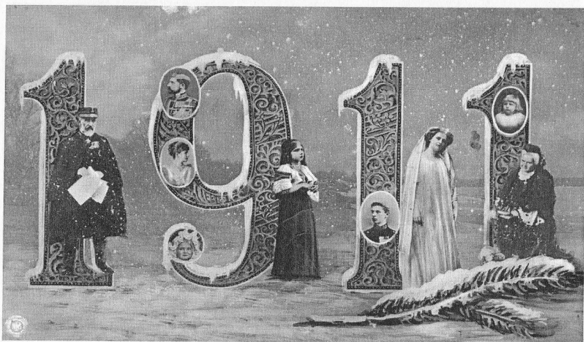
Familia regală la 1911.

Barbara Cartland, faimoasa romancieră, autoare de best-seller-uri internaționale, vedea o copilărie fericită, dar constata o carență a copilăriei prințului: faptul că nu a avut companie feminină, doar băieți, refuzând fetele Știrbey. Era totuși „îngrozitor de singur” 16 .