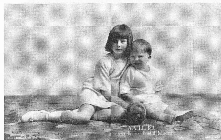
Altetele Lor Regale, Prințesa Ileana și Prințul Mircea.