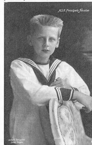
Altetea Sa Regală, Principele Nicolae.