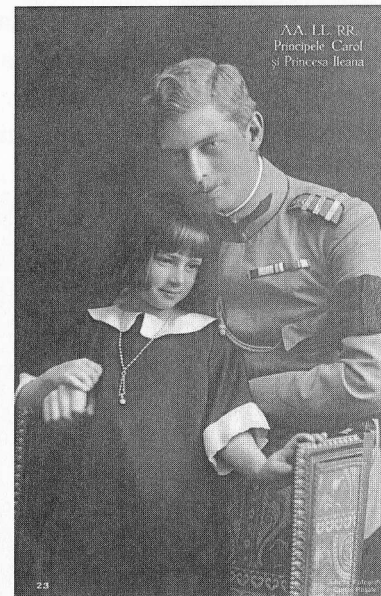
Altetele Lor Regale, Principele Carol și Prințesa Ileana.